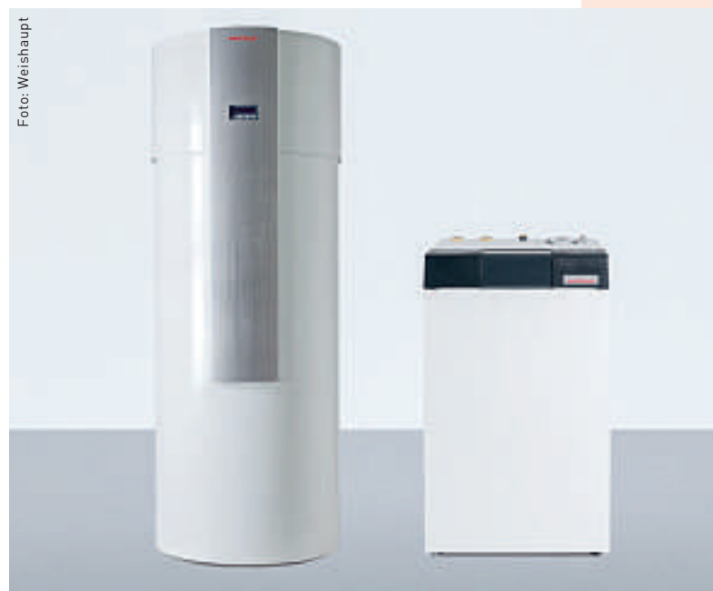
Öl-Brennwertkessel WTC-OB in Kombination mit einem Wärmepumpenboiler WWP 300 WA.